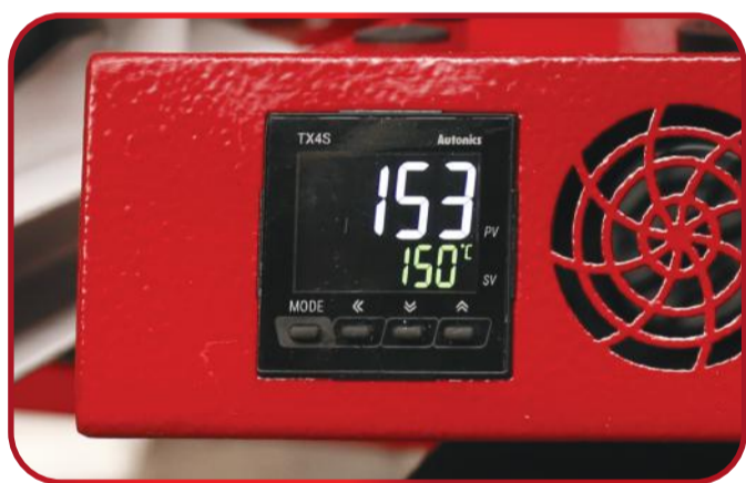
Цифровые регуляторы температуры