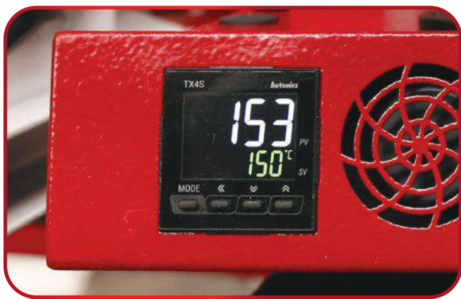
Цифровые регуляторы температуры